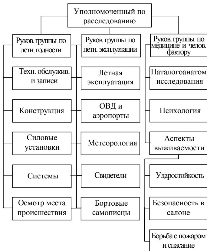
Рис. 4. Функциональная организация групп по расследованию крупного авиационного происшествия

В Требованиях ИКАО [8] прописана хронология расследования авиационного происшествия, именуемая системой организации расследования. Эта система градирует деятельность по расследованию на функциональные события. Каждому событию присвоен номер с соответствующим описанием (табл. 2). Перечень событий в системе организации расследования описывается графом состояния.