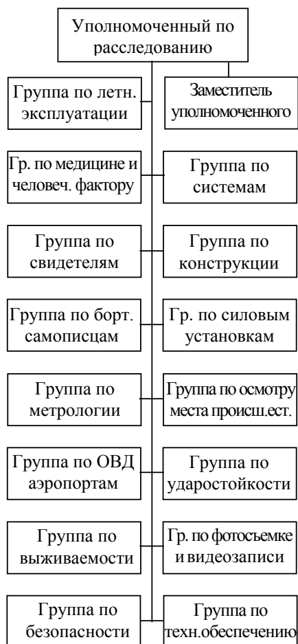
Рис. 3. Организация бригады по расследованию крупного происшествия

По мере необходимости уполномоченный по расследованию создает рабочие группы для охвата различных функциональных областей расследования (рис. 3). Группы расследователей, как правило, можно разбить на две категории: летно-эксплуатационную и инженерно-техническую (рис. 4) [8].