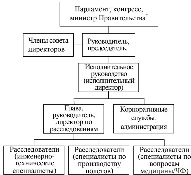
Рис. 1. Организационная структура полномочного органа

*Полномочный орган по расследованию не должен быть подотчетен министру, ответственному за государственное регулирование, контроль и надзор в сфере обеспечения безопасности полетов воздушных судов гражданской авиации.