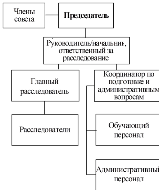
Рис. 2. Типовая организационная структура РОАИП по расследованию авиационных происшествий

*Полномочный орган по расследованию не должен быть подотчетен министру, ответственному за государственное регулирование, контроль и надзор в сфере обеспечения безопасности полетов воздушных судов гражданской авиации.