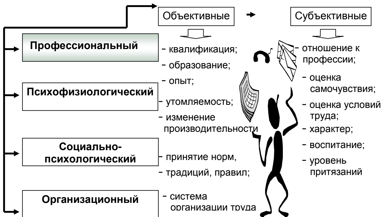
Рис. 1. Аспекты трудовой адаптации

информации, научиться навыкам работы. Даже если молодой специалист уже ранее имел подработку во время учёбы, он все равно будет испытывать стресс от незнакомой обстановки. И практически каждый из молодых специалистов задается вопросом о том, правильно ли он выбрал место работы.