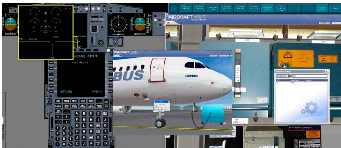
Рис. 3. Выполнение процедуры на тренажере

многих других процедур, при которых замена блока не является причиной устранения неисправности. Например, после замены блока приходится проверять проводку, запайку штепсельных разъёмов, где тоже встречаются и моделируются тренажером неисправности. В случае выполнения процедуры Troubleshooting с отрицательным результатом в руководстве TSM имеются последующие указания по устранению неисправности.