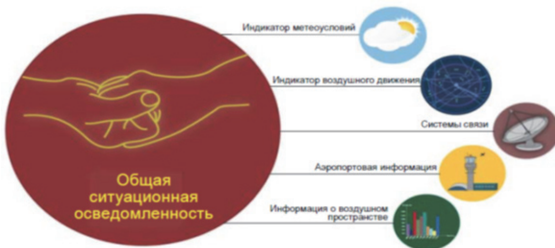
Рис. 2. Общее принятие решения Fig. 2. Shared decision-making

CDM в аэропорту представляет собой набор усовершенствованных процессов, обеспечиваемых взаимосвязью различных информационных систем эксплуатационных подразделений в аэропортах. CDM в аэропорту может быть относительно простой и малозатратной программой (рис. 2).